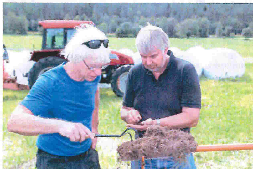
Rådgiverne studerer jordstruktur

Norsk Landbruksrådgiving Hordaland er ein medlemsorganisasjon med ca. 1540 medlemmer.