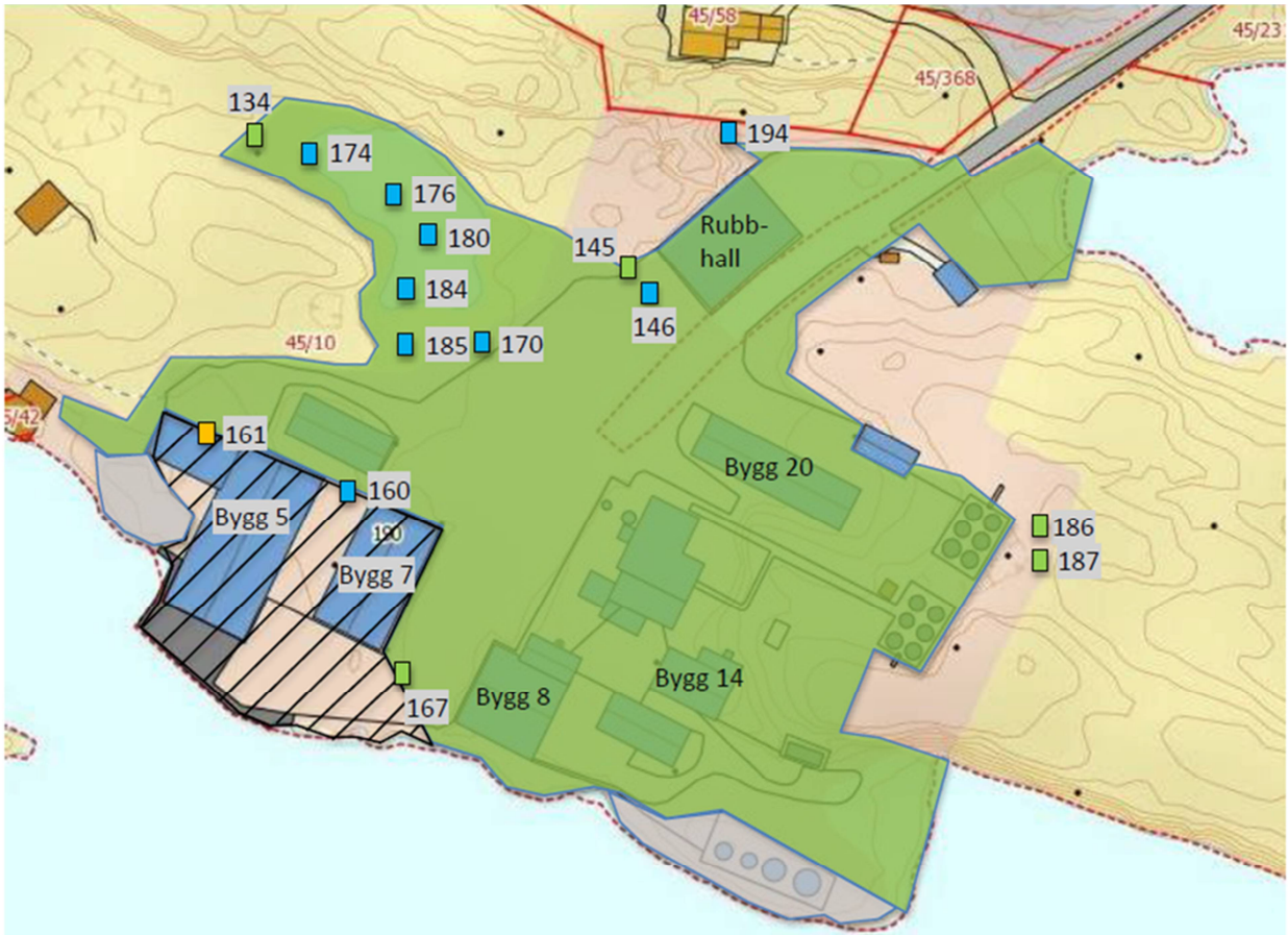
Figur 2: Prøvetakingslokaliteter og forurensningstilstand (i henhold til Miljødirektoratets veiledere TA-1468/1997 og TA-2553/2009) i gjenværende sedimenter og løsmasser i det sanerte området (grønnfarget). Skravert område markerer området som ikke er sanert, mens grått område markerer berg i dagen.