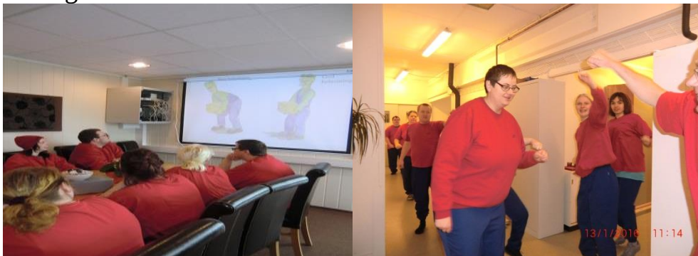
Kurs om ergonomi

Det vart drive individuell språkundervisning og me hadde ei eiga språkgruppe så lenge me hadde APS-plassar. Etter at me mista dei, og nedbemanninga var gjennomført, hadde me ikkje lenger kapasitet til det. Trongen for ei slik gruppe vart og mindre.