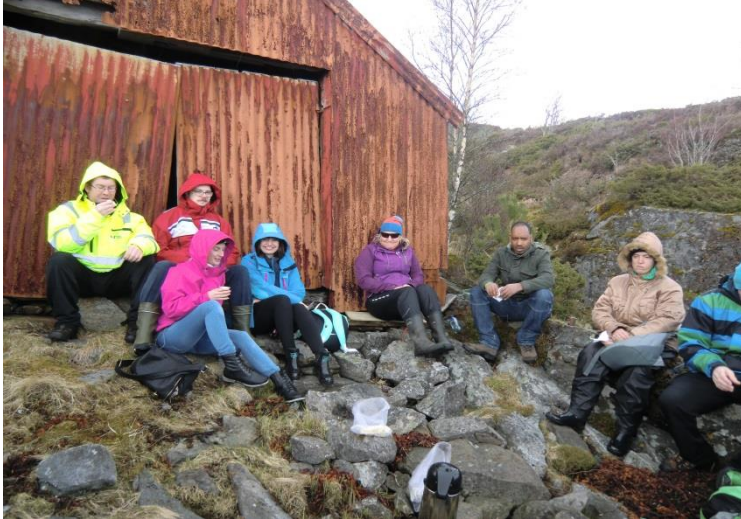
Frå ein av turane våre etter arbeid

I 2015 har Aufera fått hjelp av Nordhordland Næringshage AS og Cambio AS til å sjå på ny strategi for Aufera As. Det ligg føre to rapportar på dette arbeidet.