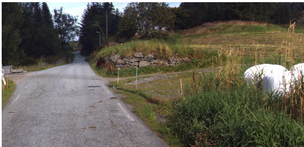
Vegbilette 2016. Støttemur og knaus som eventuelt må fjernast / flyttast.

Statens vegvesen var på synfaring 19. oktober 2016. Vi vurderte at sikta i avkøyrsla ikkje var tilfredstillande. Vi vurderer likevel at ein kan oppnå tilfredstillande sikt dersom ein fjernar sikthindrande element, særleg mot høgre i avkøyrsla (retning Kuvågen / Bøvågen).