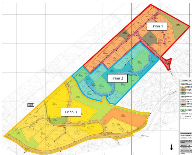
Figur 1: Kart over gjeldande plankart for Langhøyane der det er synt korleis ein meiner utbyggingstrinna bør leggjast opp.

Bakgrunnen for planendringa er ikkje å endre intensjonen med planen. Området skal framleis byggjast ut slik det er planlagt med alt av vegar, gangvegar, fortau mm. Føresegnene er imidlertid formulert sånn at all teknisk infrastruktur må byggjast ut under eitt. Dette har utbygger i etterkant sett er vanskeleg og lite hensiktsmessig. Behovet for nye bustader på Radøy er begrensa og etterspurnaden etter bustader er ikkje stor nok til at er mogleg eller tenleg å byggje ut heile feltet under eitt. Utbygger ynskjer difor å endre rekkjefølgekrava i føresegnene, slik at utbygginga av feltet kan skje stegvis.