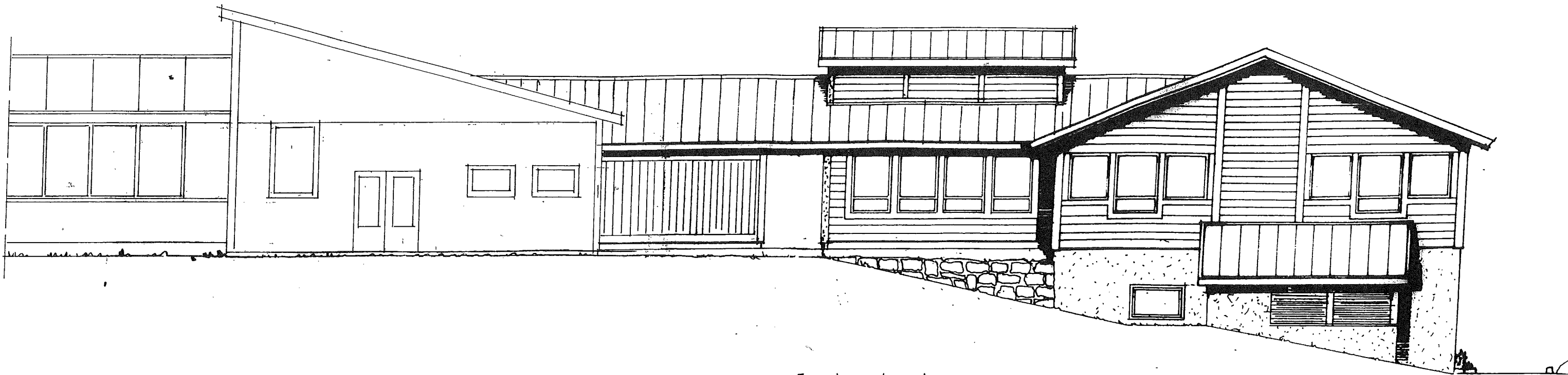
Fasade mot vest