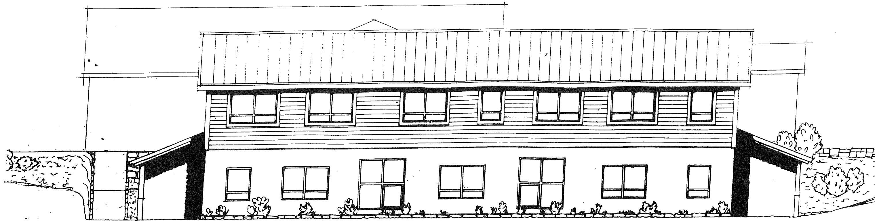
Fasade mot sør