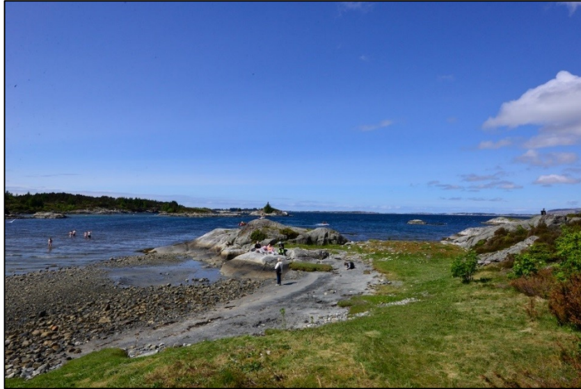
Bilete 2: Årvika er registrert som eit svært viktig friluftslivsområde i prosjektet.

Kartlegging og verdsetting av friluftslivsområde følgjer Miljødirektoratet sin rettleiar, M98-2013. Det vert lagt særleg vekt på nærturområde og grøntområde i/nær busetnad og tettstader. Det er viktig å merkje seg at kartlegging og verdsetting av friluftslivsområde er ei temakartlegging, ikkje ein juridisk bindande plan.