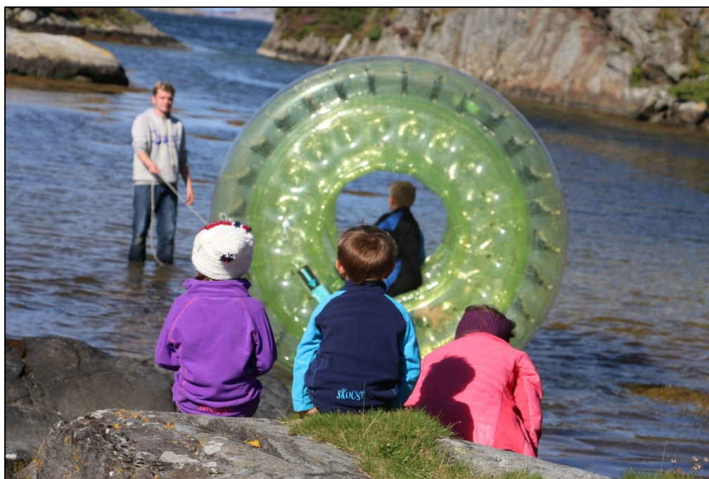
Bilete 1: Friluftsliv er viktig for både store og små.