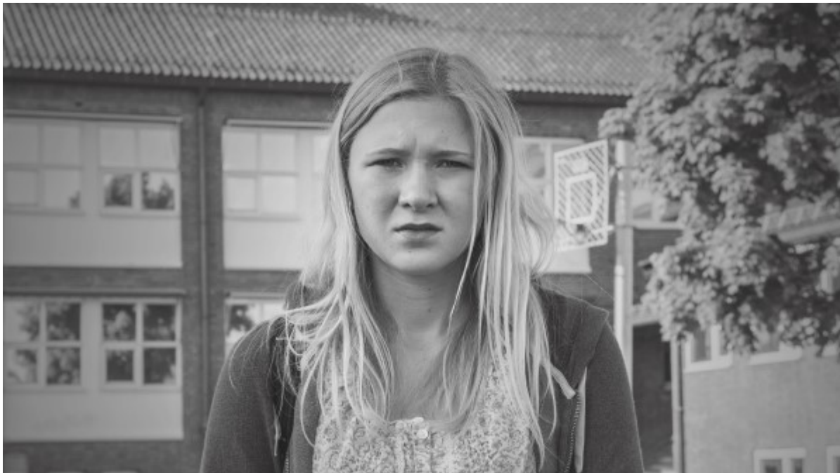
Illustrasjonsfoto, fra På Kanten-aksjonen september 2016