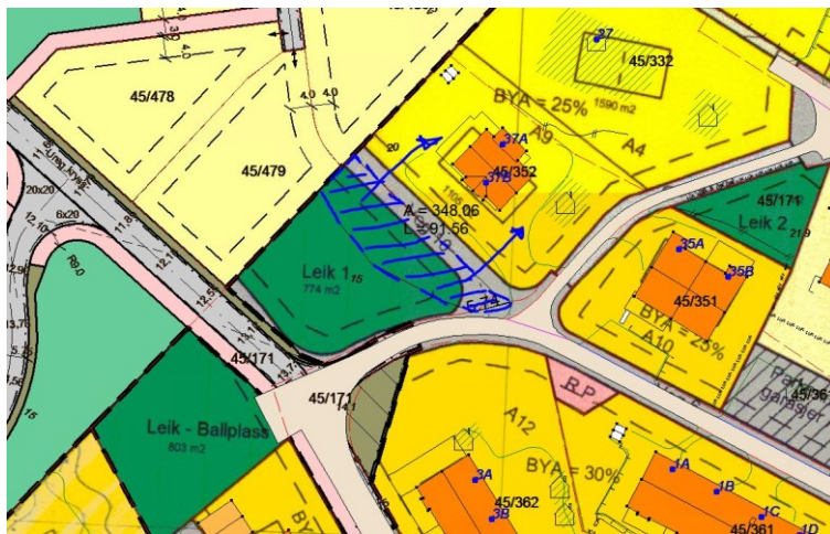
Utsnitt frå reguleringsplan

Avgjevareigedomen har arealføremål veg og leik i gjeldande reguleringsplan for Manger – del av Urhaug C, PlanID 12601992000200.