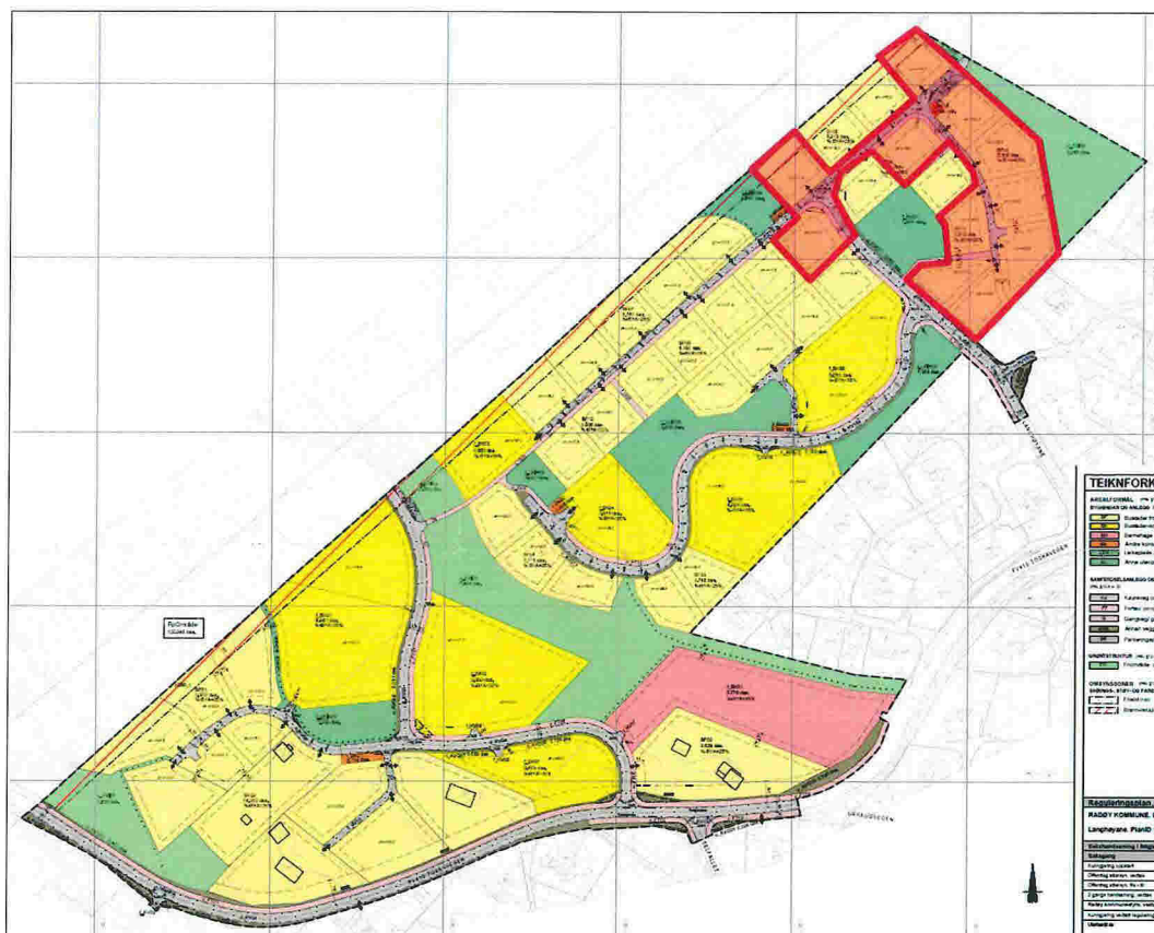
Figur 2: Gjeldande plankart for Langhøyane der det er synt med raud markering kvar ein ynskjer å gjere endringar.

Endringane går ut på at ein endrar planeringshøgde og avkøyrslar til nokre av tomtane innanfor det rauda området på kartet under, samt at ein endrar bygge- og tomtegrense for to av tomtene.