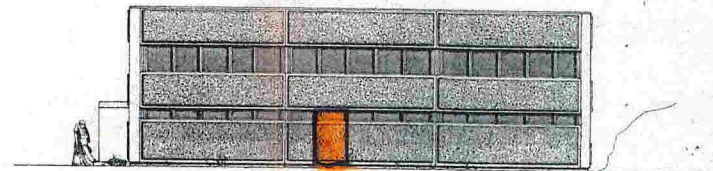
FASADE I AKSE A