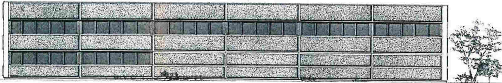
FASADE I AKSE 1