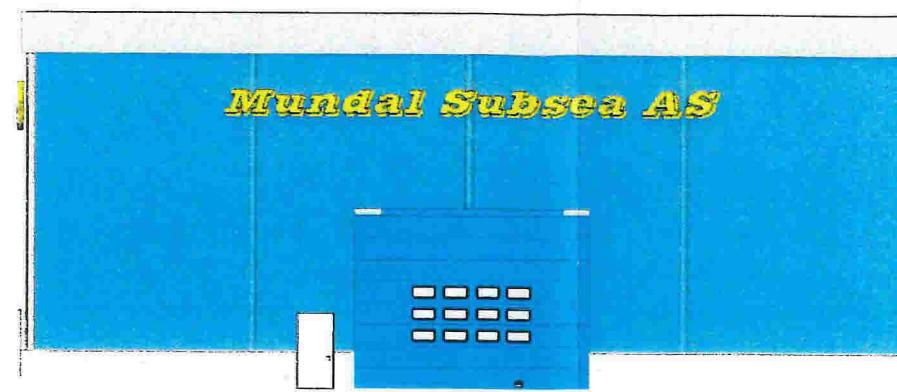
2 Nord-vest 1 : 100