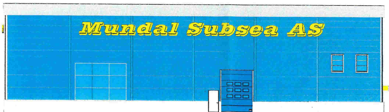
4 Sør-vest 1 : 100