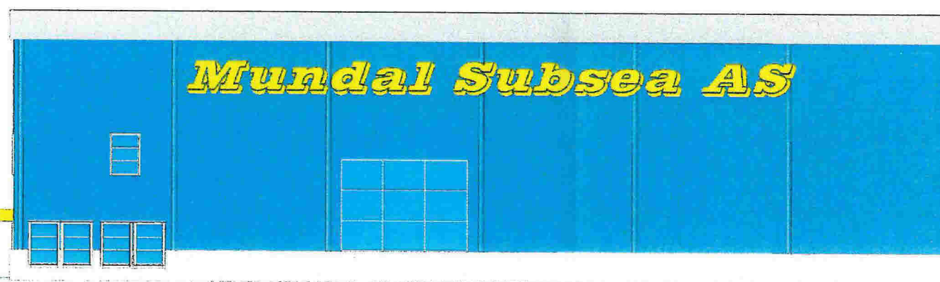
3 Nord-øst 1 : 100