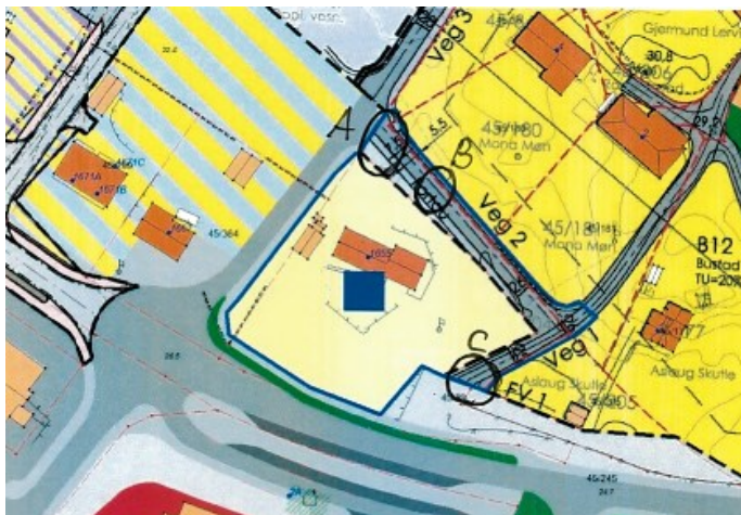
Figur: Skisse til løysing

KDP for Manger sentrum legg føringar på kva som kan realiserast innanfor felt B4. Vi vil ikkje motsetje oss at det vert lagt fram eit forslag slik det er skissert. Vi ser likevel at framlegget kan by på ei rekke utfordringar. Framlegget vi har fått tilsendt er heller ikkje detaljert, slik at vi kan ikkje ta endeleg stilling til forslaget.